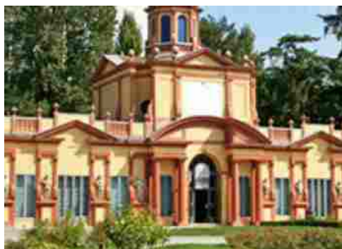
Modena giardini della arti

AMARTYA SEN, EVENTI MODENA, GIARDINI DUCALI DI MODENA, I GIARDINI DEL GUSTO E DELLE ARTI, MASSIMO BOTTURA, PALAZZINA VIGARANI MODENA, PIACERE MODENA, STORIE DI GUSTO